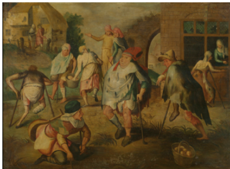
Master of the Prodigal Son: Beggars' neighborhood (ml. 1530 og 1560)